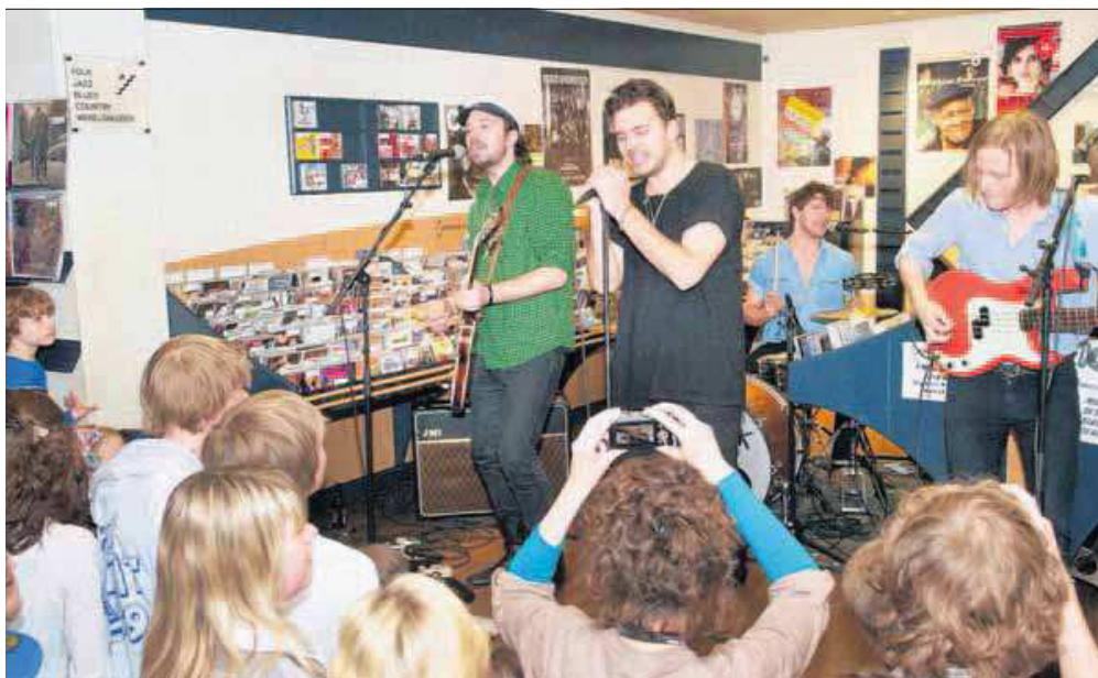
Het optreden van de band Go Back to the Zoo bij Kroese in de Rijnstraat trok veel publiek.