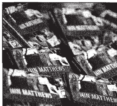
Cd's liggen klaar voor de verkoop.